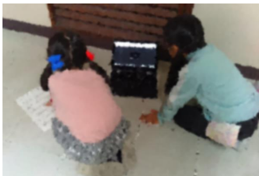
2年生 タブレットを使っでの学芸会練習